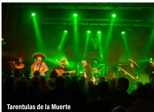
Tarentulas de la Muerte

🌐 Réservation : https://www.helloasso.com/.../evenements/cat-s-and-dogs