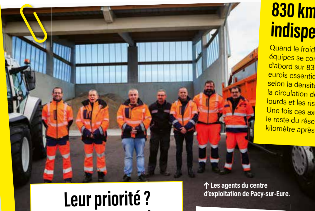
↑ Les agents du centre d'exploitation de Pacy-sur-Eure.

Quand le froid frappe, les équipes se concentrent d'abord sur 830 km d'axes eurois essentiels, choisis selon la densité du trafic, la circulation des poids lourds et les risques du tracé. Une fois ces axes sécurisés, le reste du réseau suit, kilomètre après kilomètre.