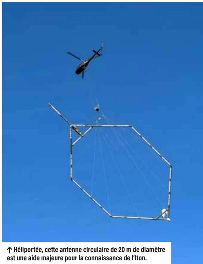
↑ Héliportée, cette antenne circulaire de 20 m de diamètre est une aide majeure pour la connaissance de l'Iton.